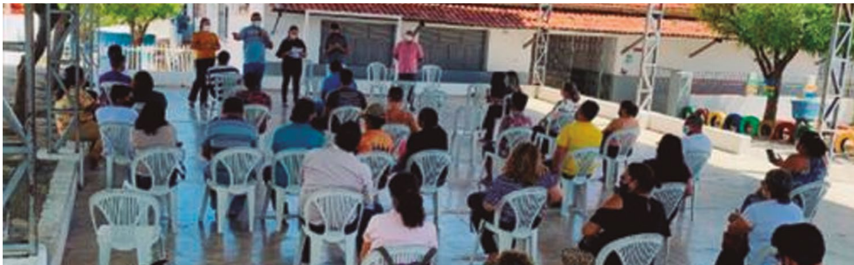
REUNIÃO DO CONSELHO MUNICIPAL DE CULTURA

Apresentação das etapas já cumpridas pelo Consórcio; Apresentação do relatório das últimas ações Geoparque Seridó, em todo território;