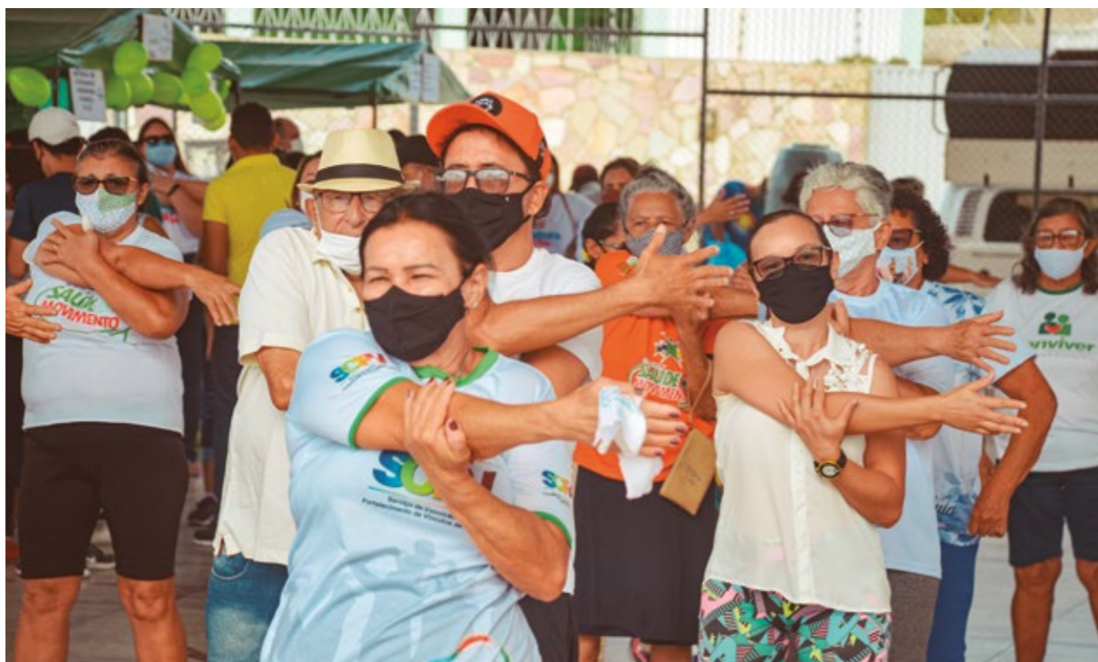
PROJETO “PREFEITURA EM AÇÃO”

e principalmente a Sidys, oferecendo internet, através do seu cabeamento e total condições para a viabilidade desse projeto. É uma estratégia de segurança, tanto preventiva como esse material servirá também para resolução de delitos.” disse.