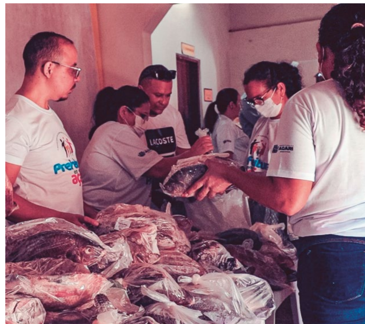
FAMÍLIAS ACARIENSES FORAM BENEFICIADAS COM GESTO SOLIDÁRIO DA PREFEITURA

A administração municipal, por meio da Secretaria de Desenvolvimento Econômico e Turismo da cidade, desenvolveu dois materiais gráficos para divulgar as belezas de Acari, enaltecer a cultura e incentivar o turismo local. Os impressos foram disponibilizados para a população e visitantes