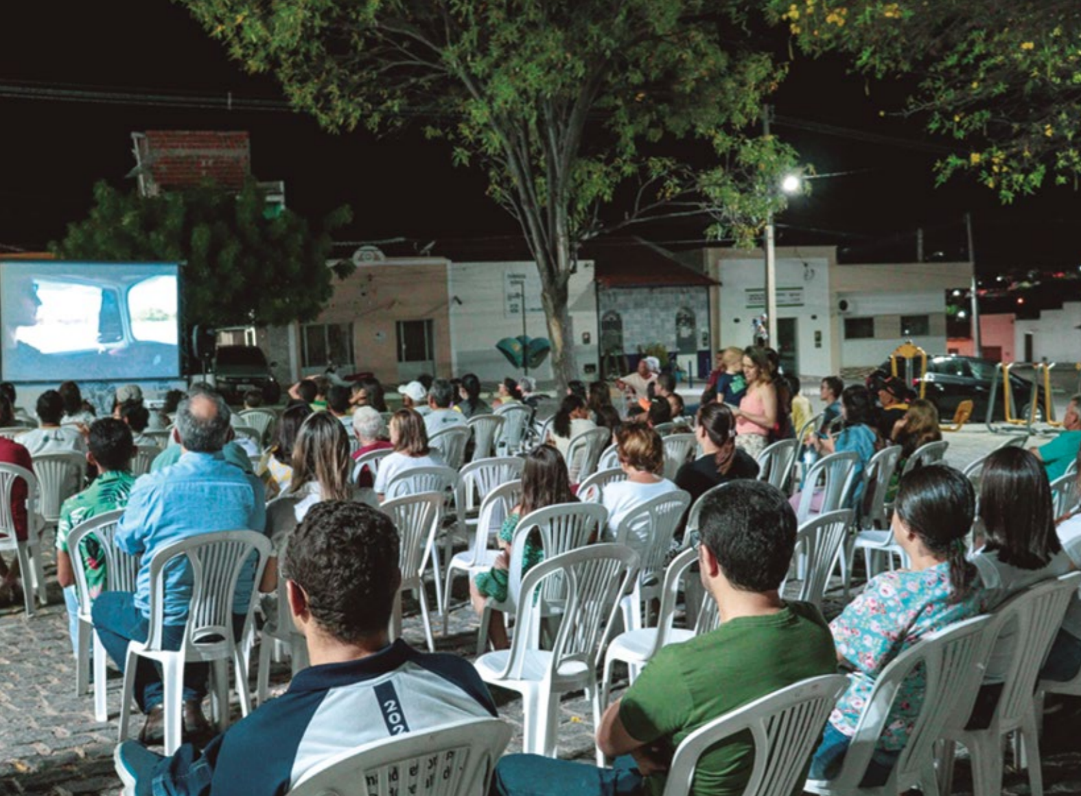
KURTA DA KOMBI: PROJETO EXCLUSIVO DE CINEMA DE RUA

considera o ensino das competências socioemocionais, que incluem autoconfiança, colaboração, resiliência e outros.