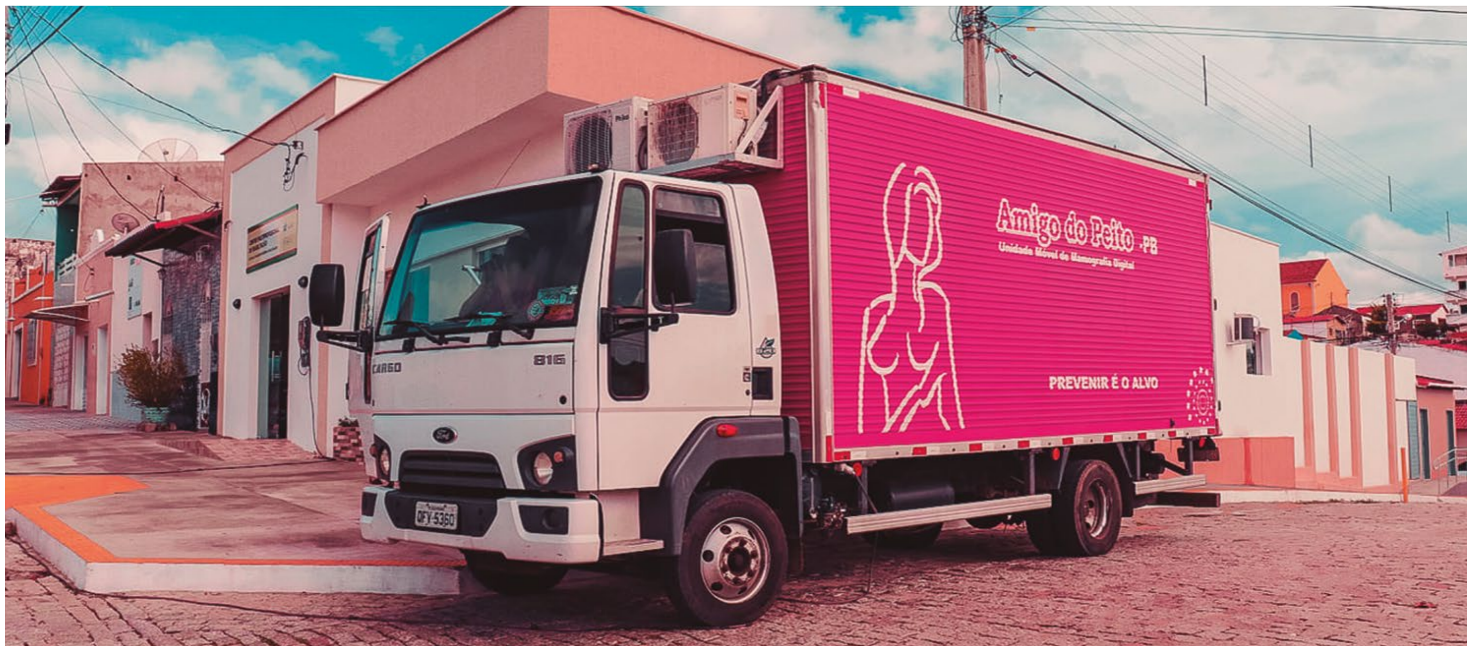
PARCERIA: UNIDADE MÓVEL USADA PARA PROCEDIMENTOS DE MAMOGRAFIA

ção em toda extensão da zona rural de Acari.