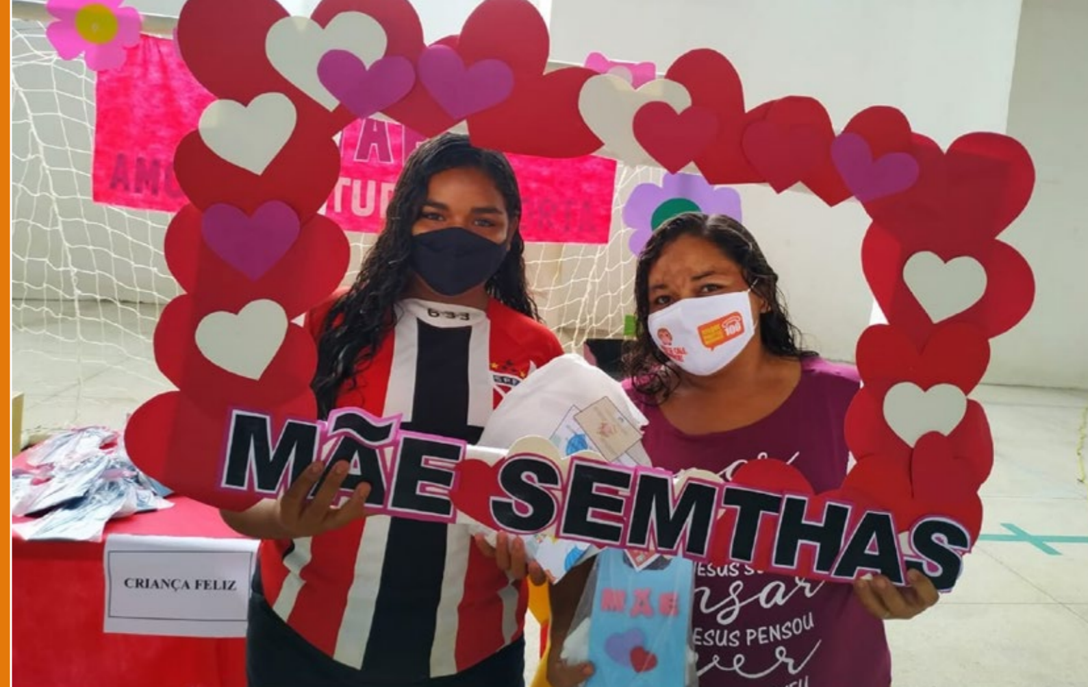
MÃES DE ACARI FORAM HOMENAGEADAS

“VAMOS DAR CONDIÇÕES PARA O MELHOR ESCOAMENTO DOS PRODUTOS PRODUZIDOS PELO HOMEM DO CAMPO”