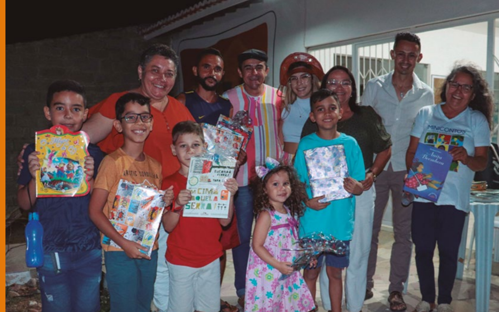
ENCONTRO LITERÁRIO EM GARGALHEIRAS

A AÇÃO DE LIMPEZA, ALÉM DE CONTRIBUIR PARA O BEM ESTAR DA POPULAÇÃO, É UMA FORMA DE CONSCIENTIZAÇÃO, PARA QUE TODOS APRENDAM A JOGAR O LIXO NO LIXO