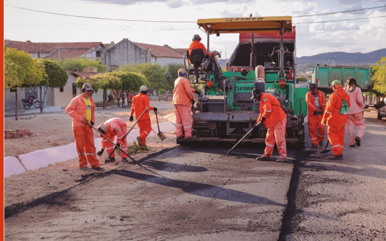
RECAPEAMENTO ASFÁLTICO NO BAIRRO PETRÓPOLIS