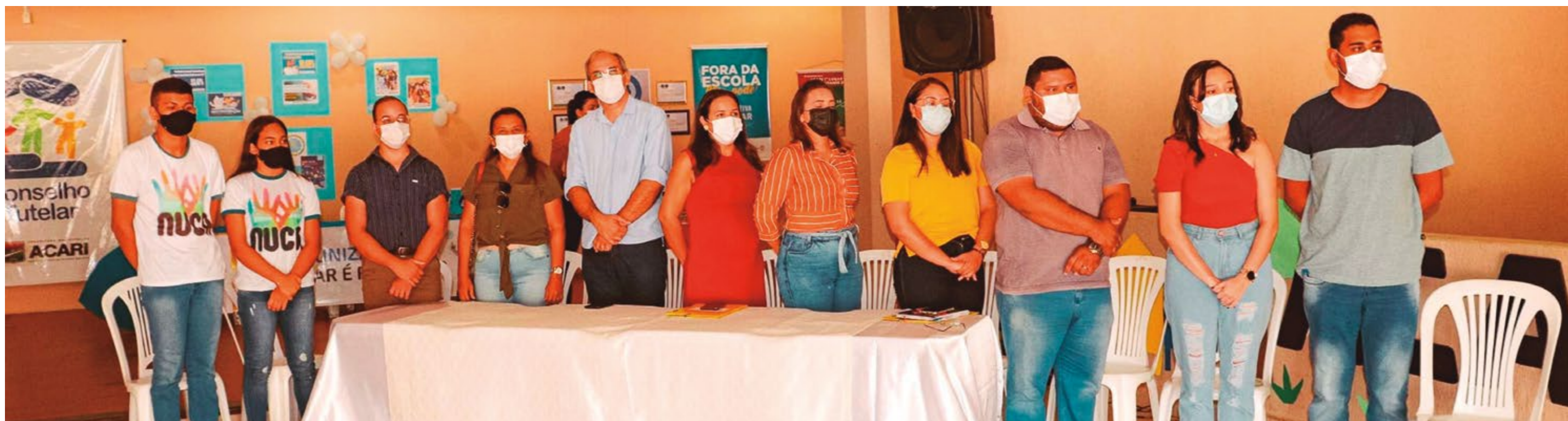
I FÓRUM COMUNITÁRIO DO SELO UNICEF, EDIÇÃO 2021-2024

rismo, realizou a entrega de certificados de conclusão dos cursos de Costura Industrial. A entrega aconteceu no modo “drive-thru”, em tendas montadas em frente à secretaria.