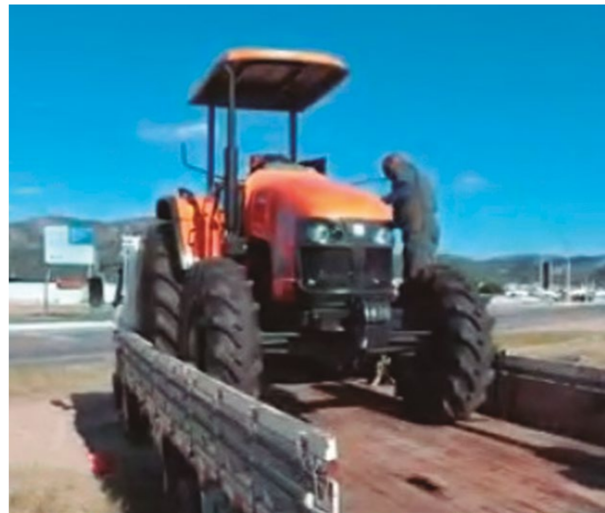
PREFEITURA DE ACARI ADQUIRIU MAIS UM TRATOR PARA O MUNICÍPIO

A realização do evento foi executada de maneira segura. Tendo em vista o momento pandêmico que estamos vivenciando, a equipe permaneceu na parte externa do abrigo utilizando-se de carro de som.