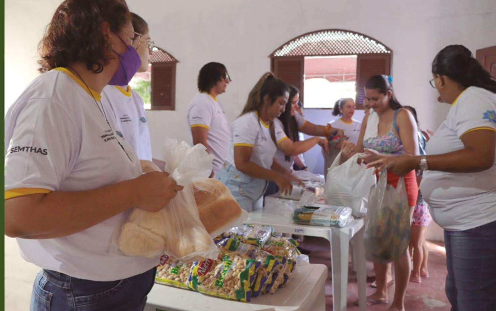
GESTO SOLIDÁRIO DISTRIBUINDO ALIMENTOS