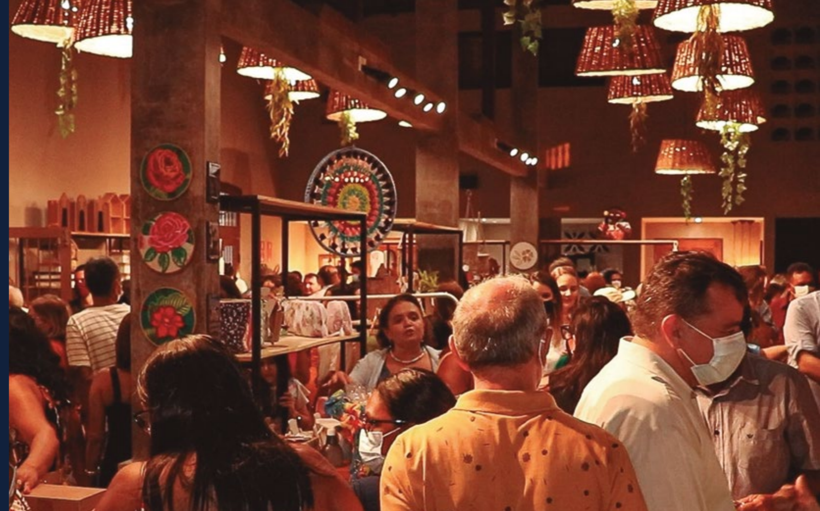
SALÃO DE ARTESANATO