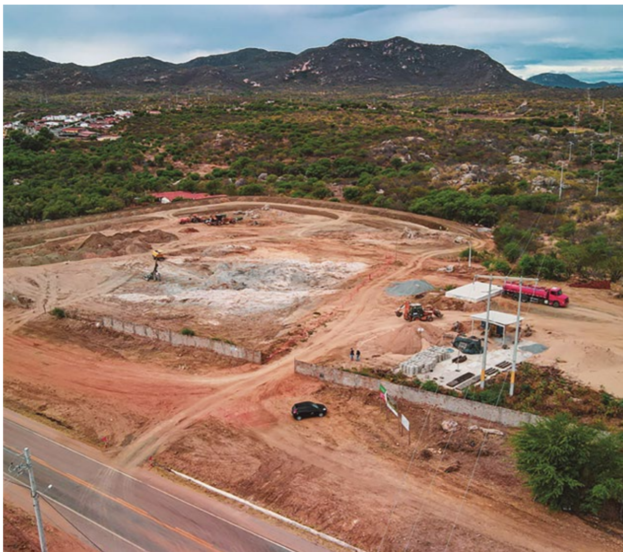
OBRAS DO PROJETO CIDADE DA MODA

venções, uma praça de convivência, lojas e salas de capacitação. A iniciativa também apresentou potencial de geração de 1000 empregos diretos, possibilitando também a geração de milhares de outros indiretos, alavancando e aquecendo a economia da cidade e região.