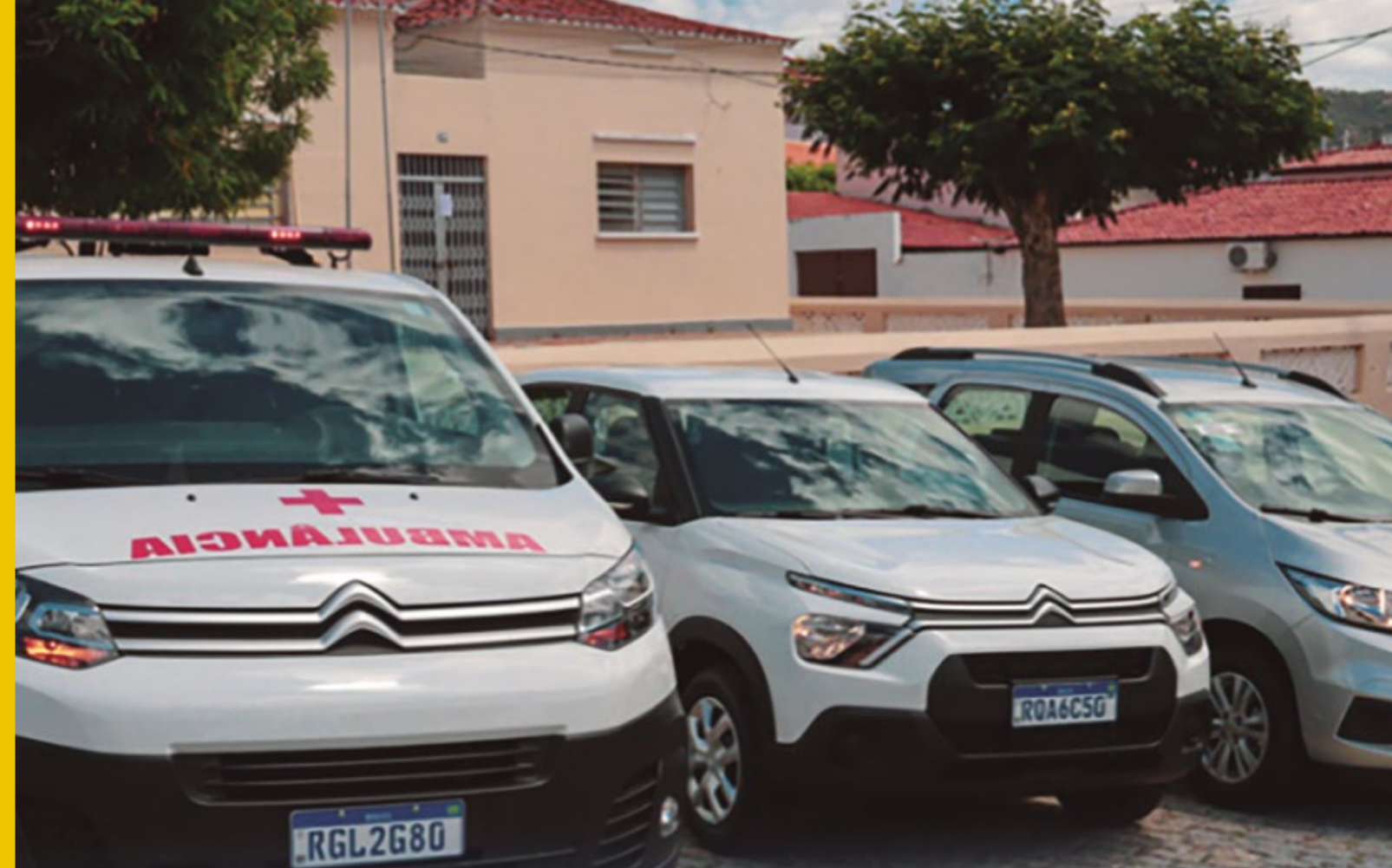
VEÍCULOS RECEBIDOS PARA A SAÚDE MUNICIPAL