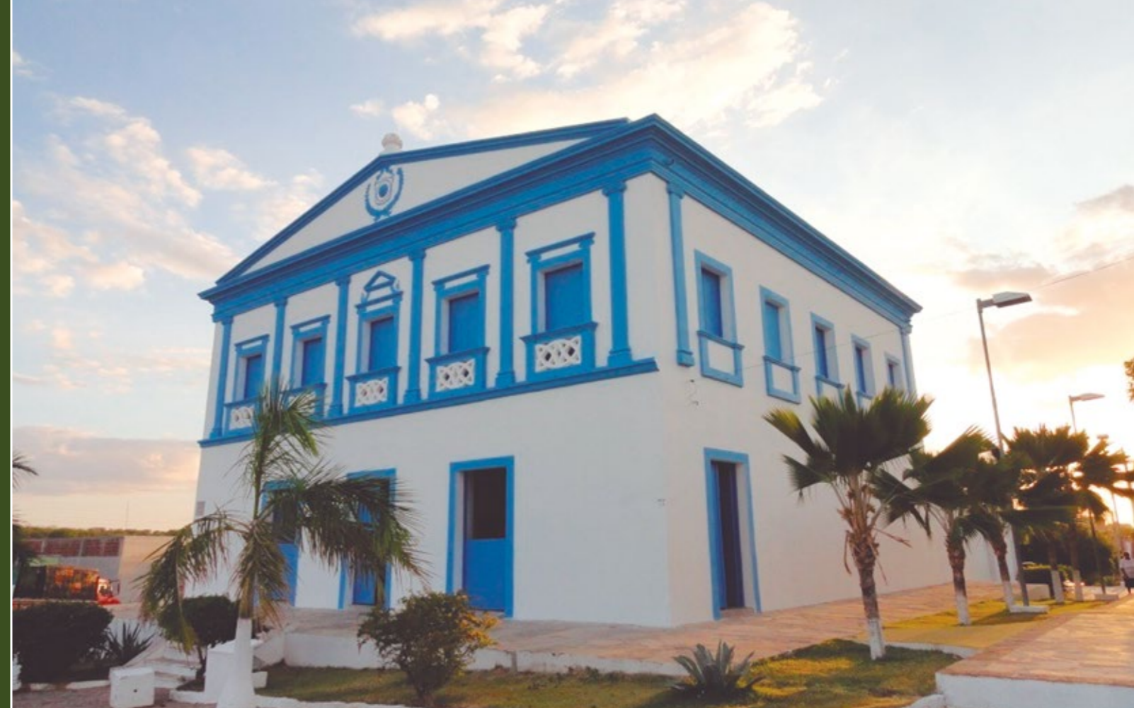
MUSEU HISTÓRICO DO SERTANEJO

“É DE FUNDAMENTAL IMPORTÂNCIA QUE, ENQUANTO PODER PÚBLICO, ESTEJAMOS ATENTOS ÀS DEMANDAS DE NOSSAS COMUNIDADES RURAIS”