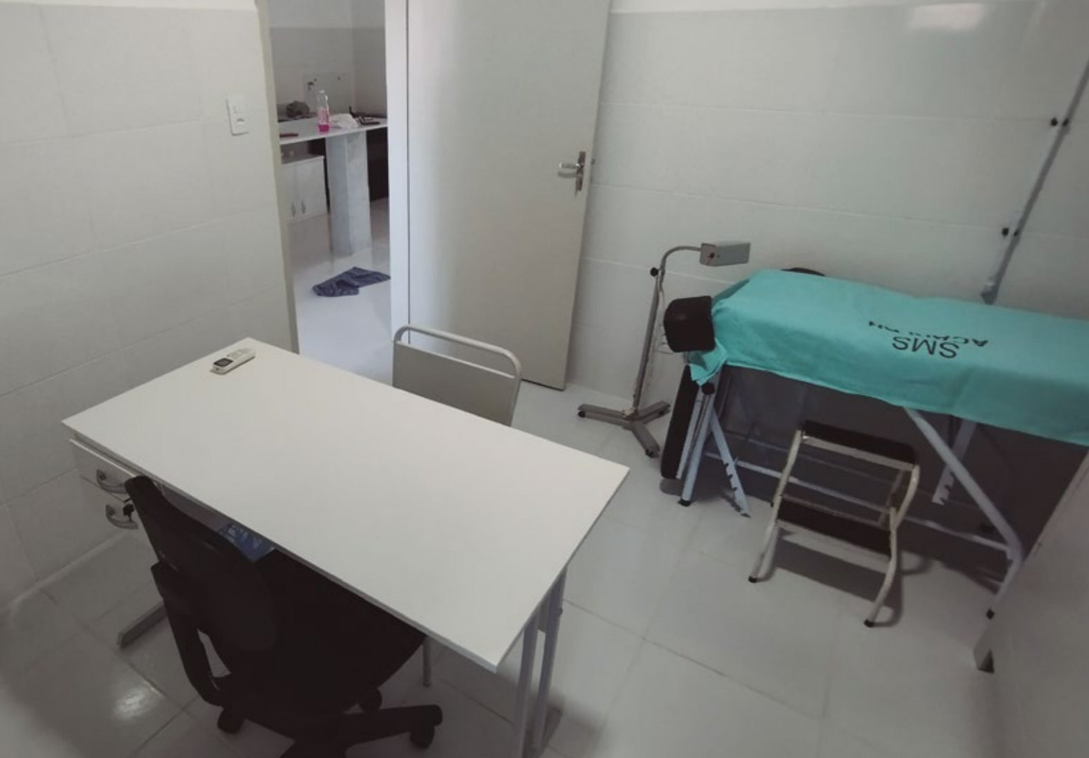
UNIDADE BÁSICA DE SAÚDE DE GARGALHEIRAS