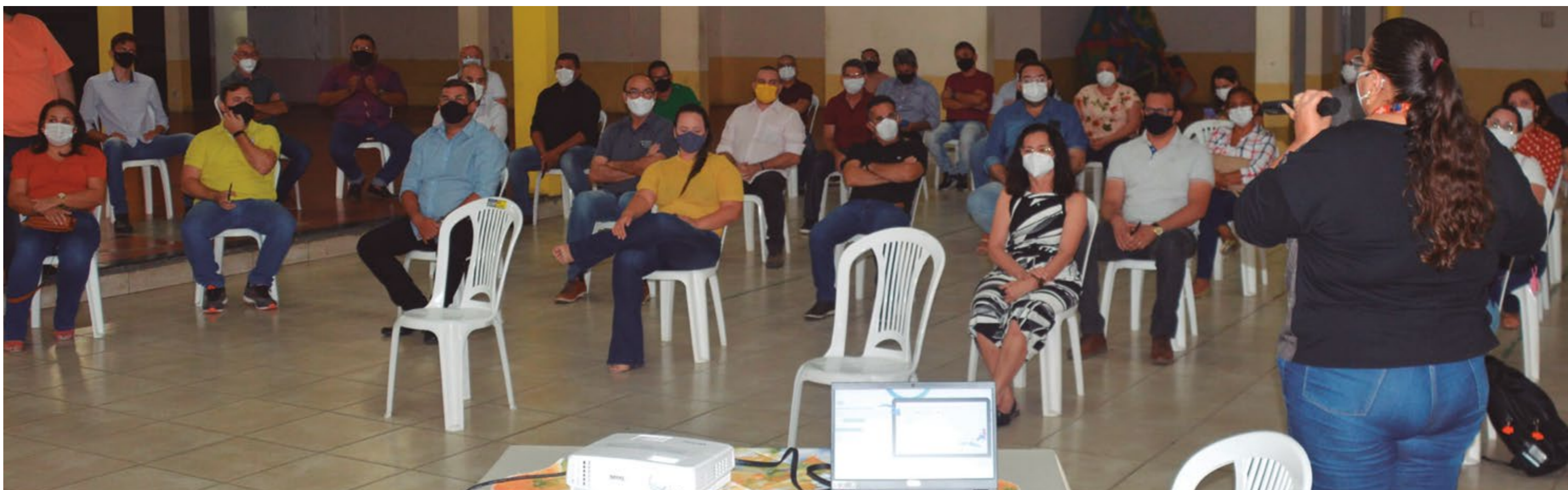
LANÇAMENTO OFICIAL DOS PROJETOS “PERTINHO DE CASA” E “ACARI COMPRA AQUI”

apresentações juninas das escolas municipais e da Assistência Social, sorteios de cestas com as famílias dos alunos e usuários dos programas sociais e música ao vivo com o grupo Só Xotear.