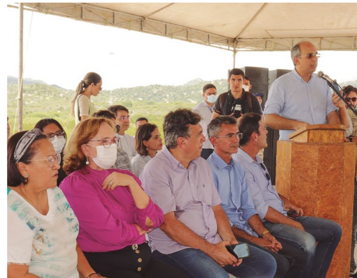
ENTREGA DO ABATEDOURO MUNICIPAL DE ACARI

Na ocasião estiveram presentes várias autoridades, com destaque para a Governadora do RN, Fátima Bezerra, que encantada com o espaço, recém criado para os artesãos, prometeu incluir a classe artesã de Acari no circuito de eventos culturais do Estado, e ainda anunciou a restauração do Grupo Escolar Tomaz de Araújo transformado em Casa de Cultura Popular.