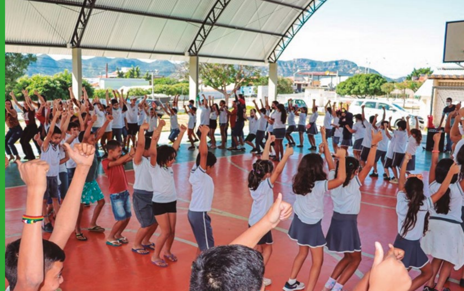
MANHÃ DE DINÂMICAS E BRINCADEIRAS EM ALUSÃO AOS 32 ANOS DO ECA

“ESSE MOMENTO DE TRAZER AS CRIANÇAS PARA UMA COMEMORAÇÃO ALUSIVA À DATA, É O RECONHECIMENTO POR PARTE DE QUEM FAZ E ATUA NAS POLÍTICAS PÚBLICAS, DE QUE ELES SÃO SUJEITOS DE DIREITOS PROTEGIDOS PELA LEI”