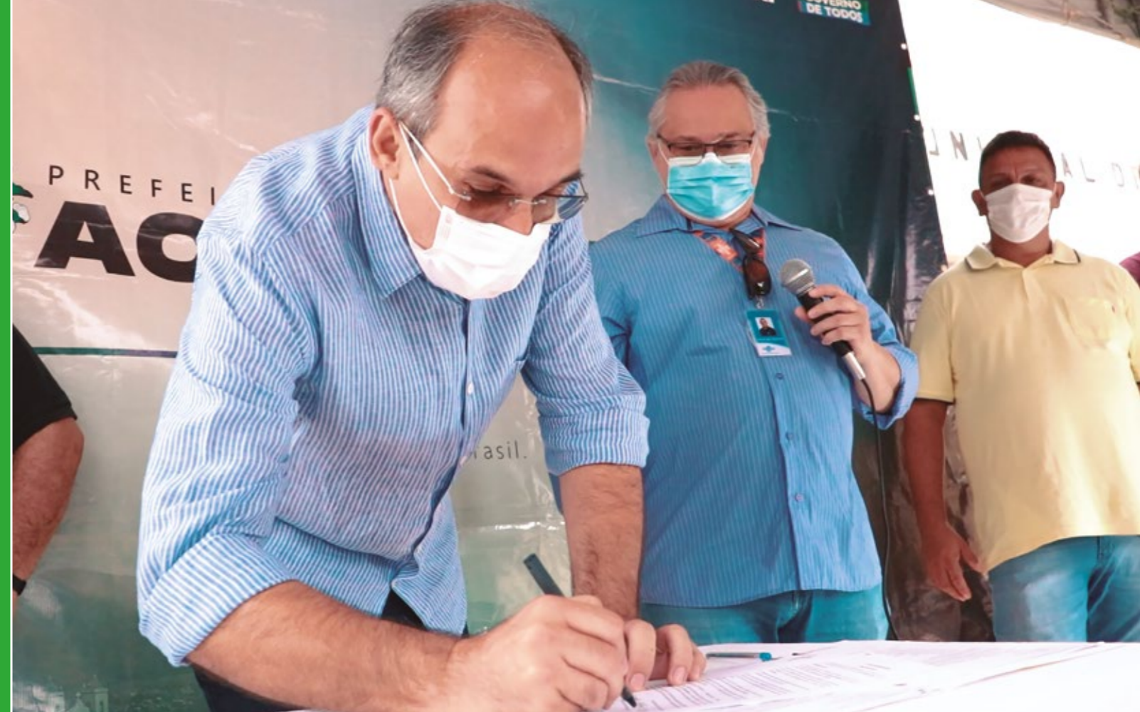
ASSINATURA DO TERMO DE ADESÃO AO PROGRAMA CIDADE EMPREENDEDORA