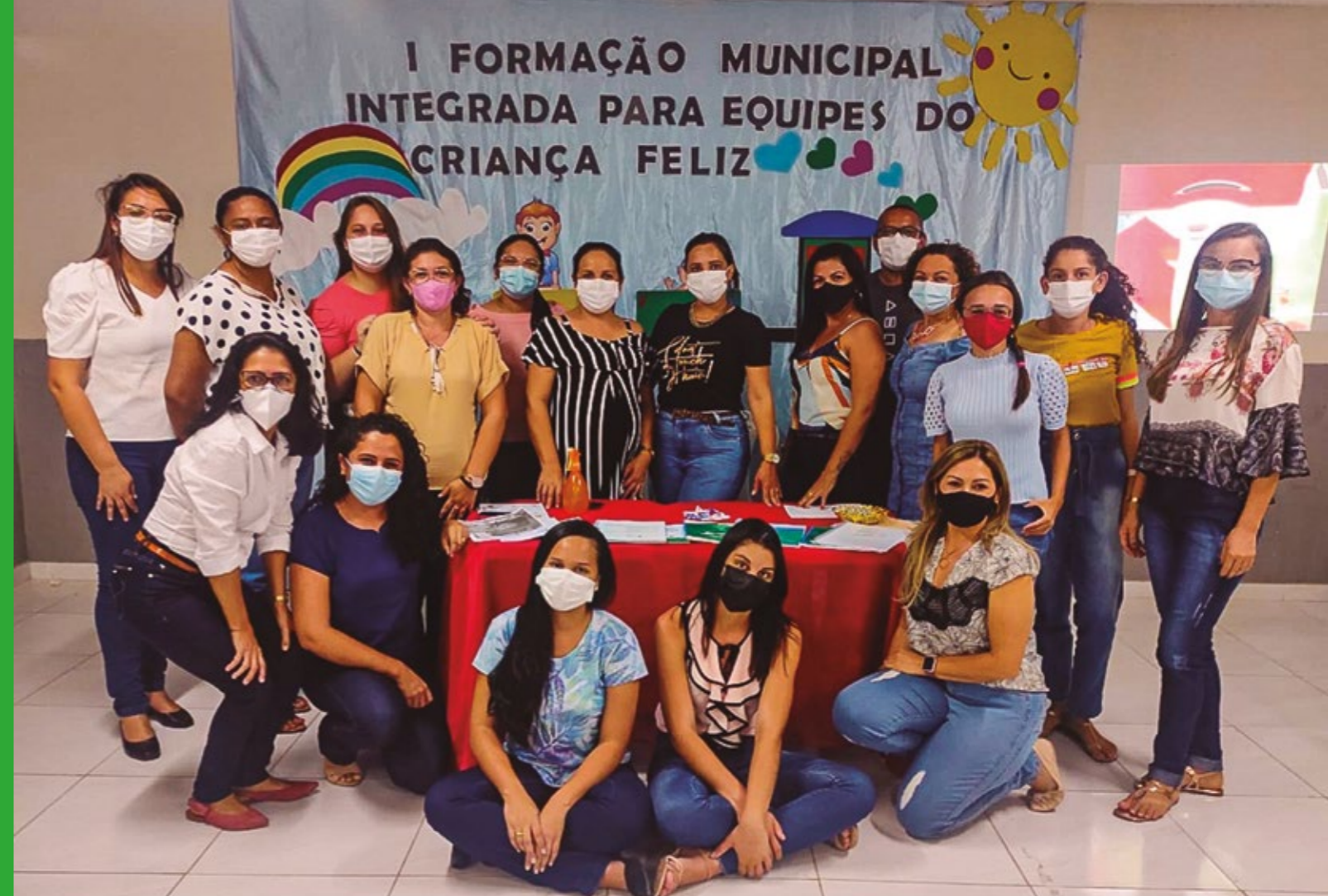
CAPACITAÇÃO DE EQUIPES DO PROGRAMA CRIANÇA FELIZ

A PREFEITURA DE ACARI LANÇOU A CAMPANHA DENGUE TAMBÉM MATA COM OBJETIVO DE CHAMAR ATENÇÃO DA POPULAÇÃO COM OS CUIDADOS QUE TODOS DEVEM TER