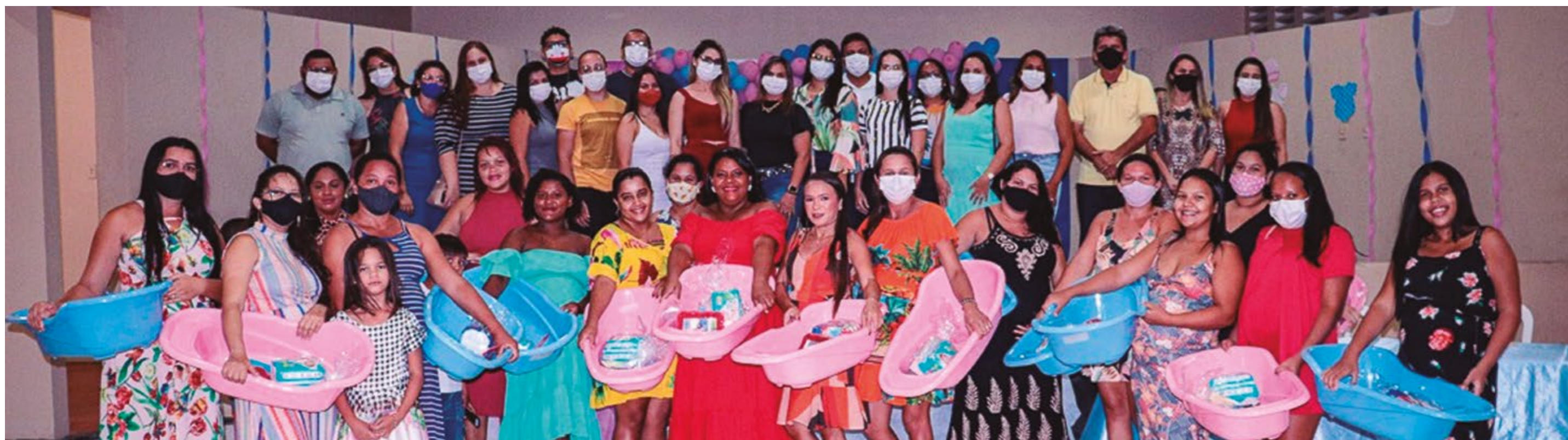
SEMANA DO BEBÊ

profissional ao homem e à mulher do campo na promoção do curso MANEJO SANITÁRIO DE BOVINOS.