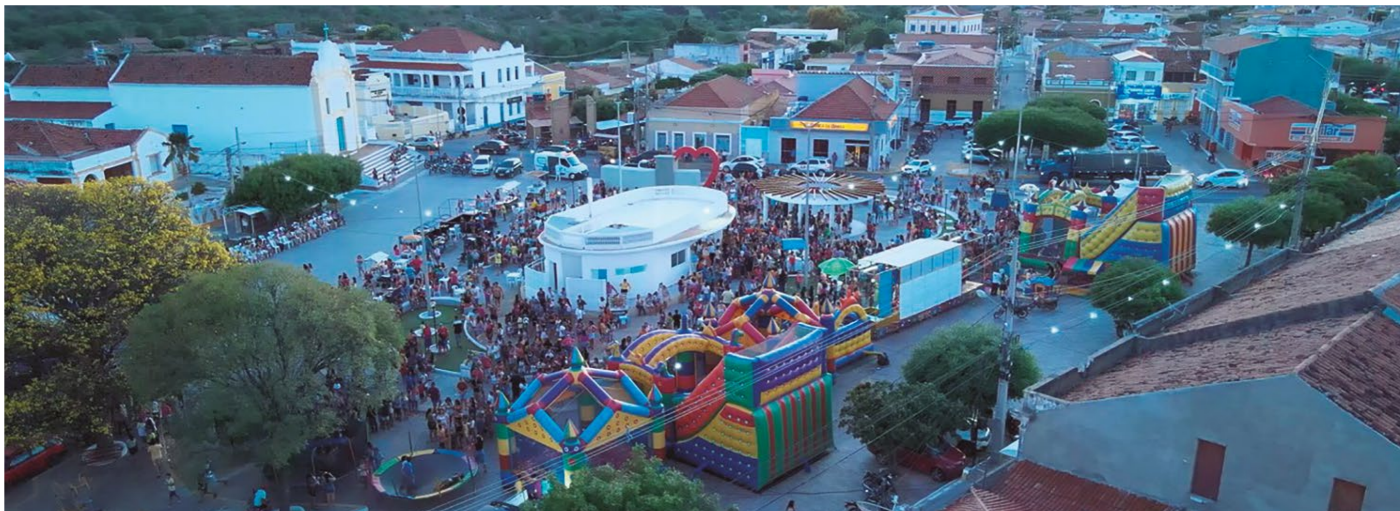
FESTA DAS CRIANÇAS

mover saúde preventiva em relação ao câncer de mama, colo do útero e câncer de boca.