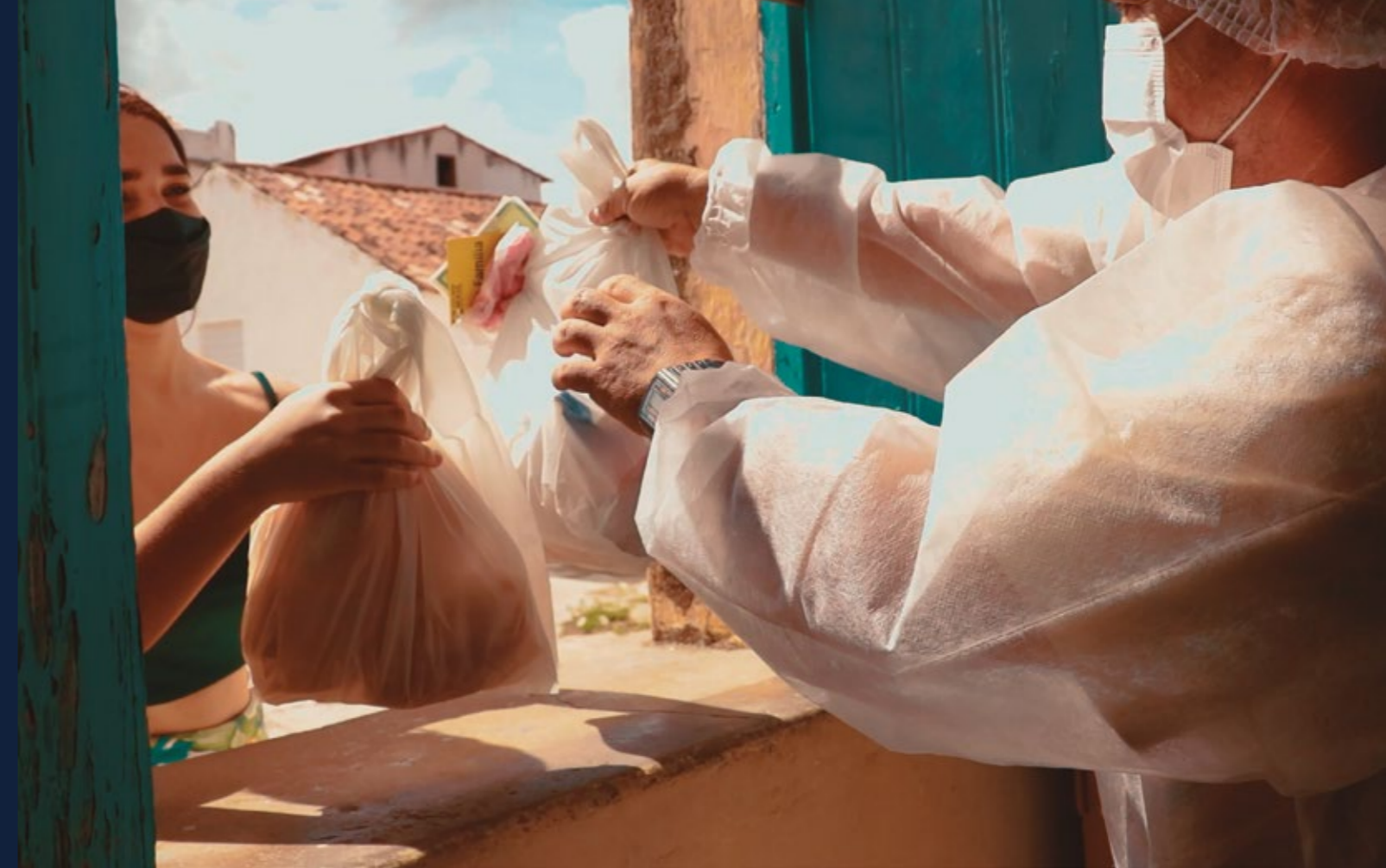
GESTO SOLIDÁRIO, DISTRIBUINDO PEIXES, PÃES E LEITE