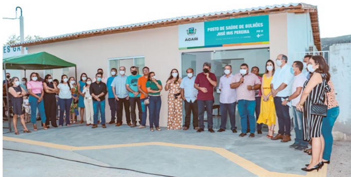
REFORMA E AMPLIAÇÃO DO POSTO DE SAÚDE DE BULHÕES