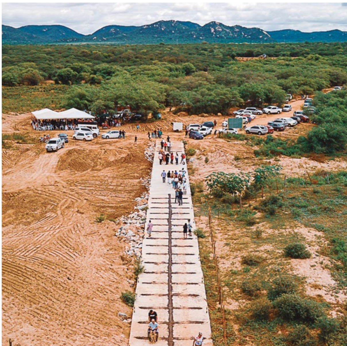
PASSAGEM MOLHADA, NO RIO ACAUÃ

rismo, condutores locais, equipes da administração municipal e população.