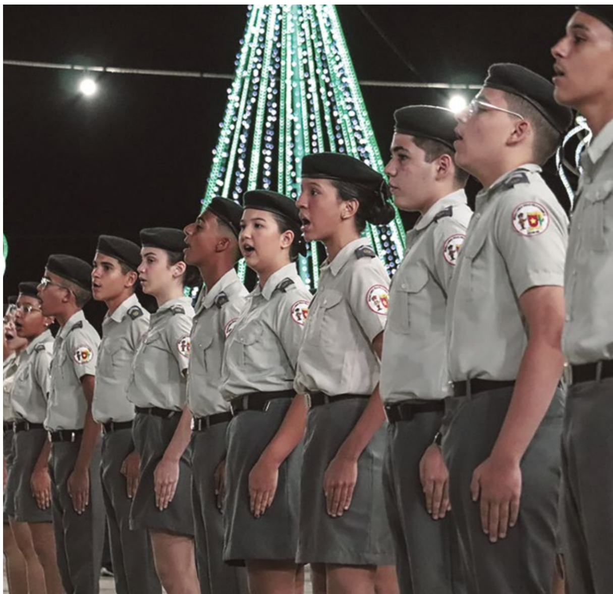
FORMATURA DE POLICIAIS MIRINS