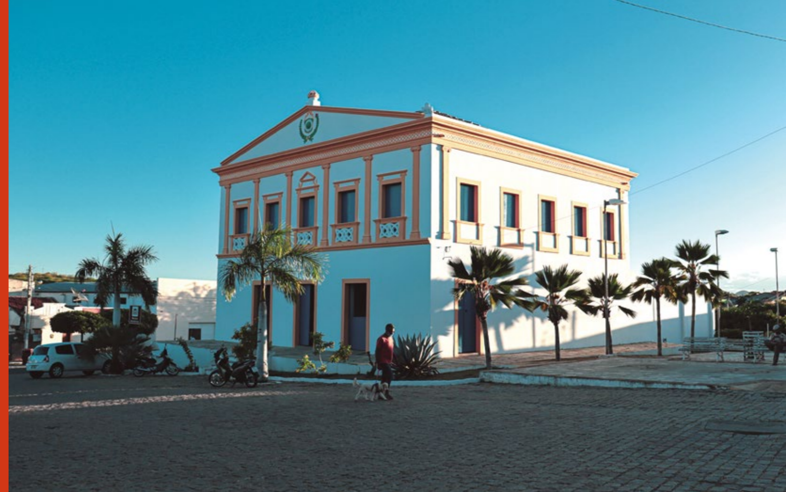
MUSEU HISTÓRICO DE ACARI