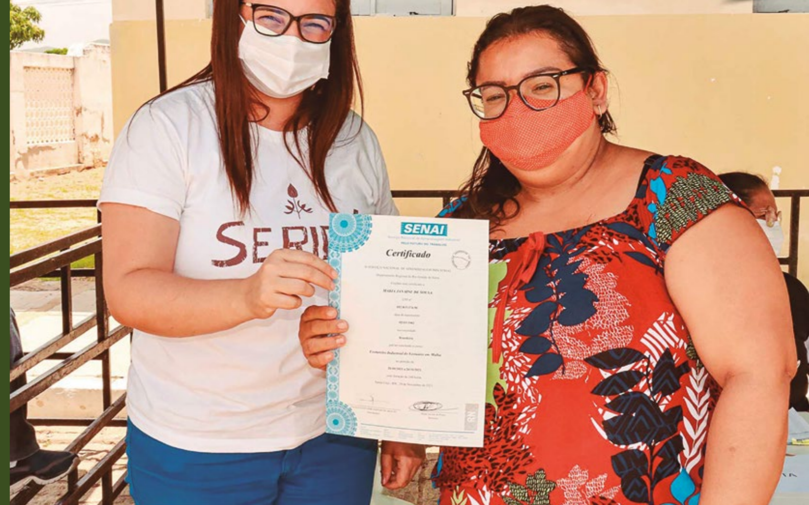
ENTREGA DE CERTIFICADOS DE CONCLUSÃO DE CURSOS DE COSTURA INDUSTRIAL