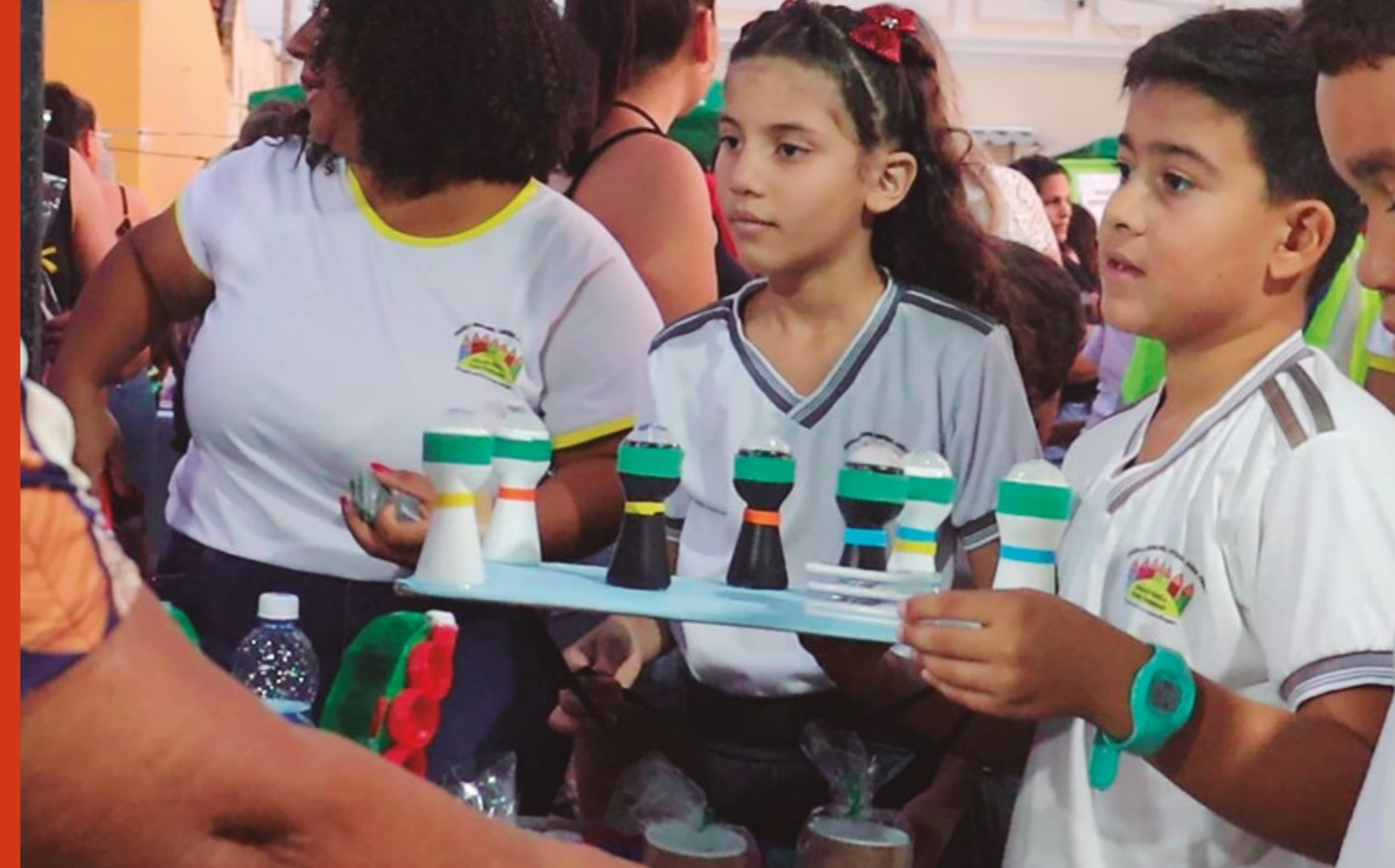
FEIRA DO JOVEM EMPREENDEDOR