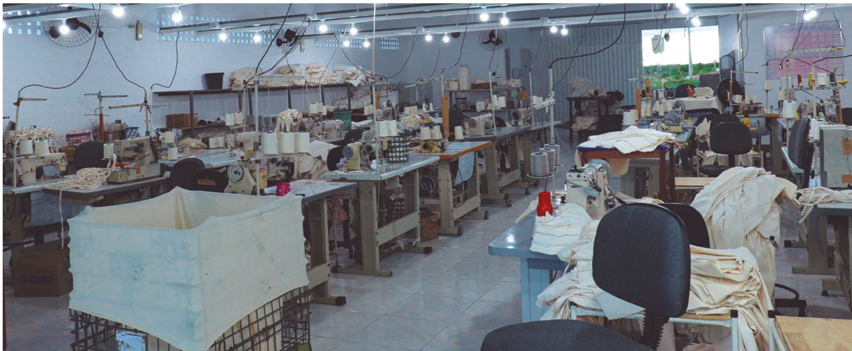
GALPÃO INDUSTRIAL, OBRA ENTREGUE OFICIALMENTE PELA PREFEITURA DE ACARI

crocrédito Empreendedor; uma parceria da prefeitura com o Governo do Estado.