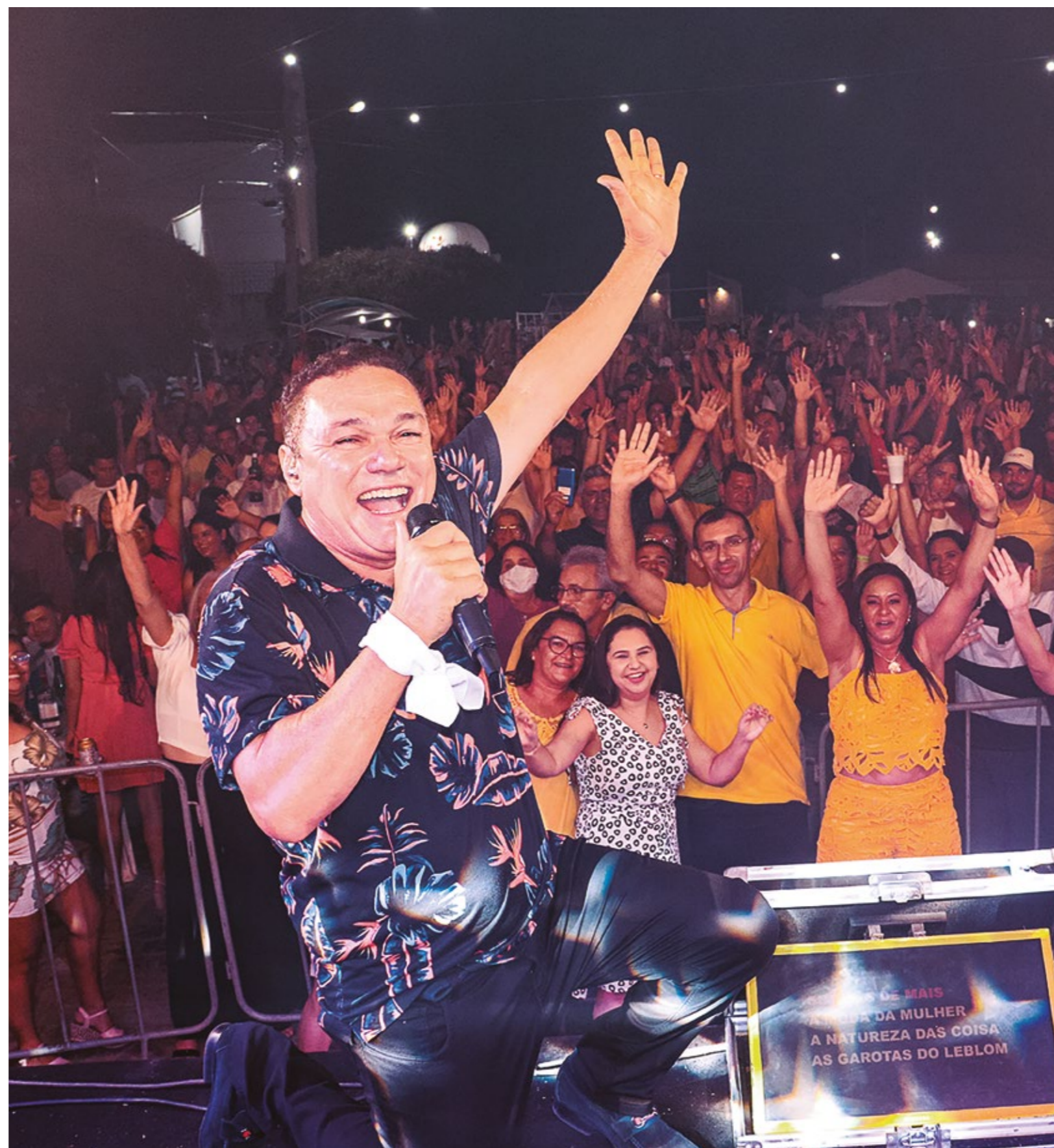
AMAZAN, NA FESTA DE REVEILLON EM ACARI

Considerado o maior evento da Festa do Rosário já realizado em Acari, em 2021 o evento ganhou um grande apoio da Prefeitura Municipal, que é sempre parceira das festividades, na estrutura física e atrações musicais/culturais. Também contou com o apoio de alguns patrocinadores, parceria com empreendedores locais que apoiam todo o calendário festivo de dezembro em Acari.