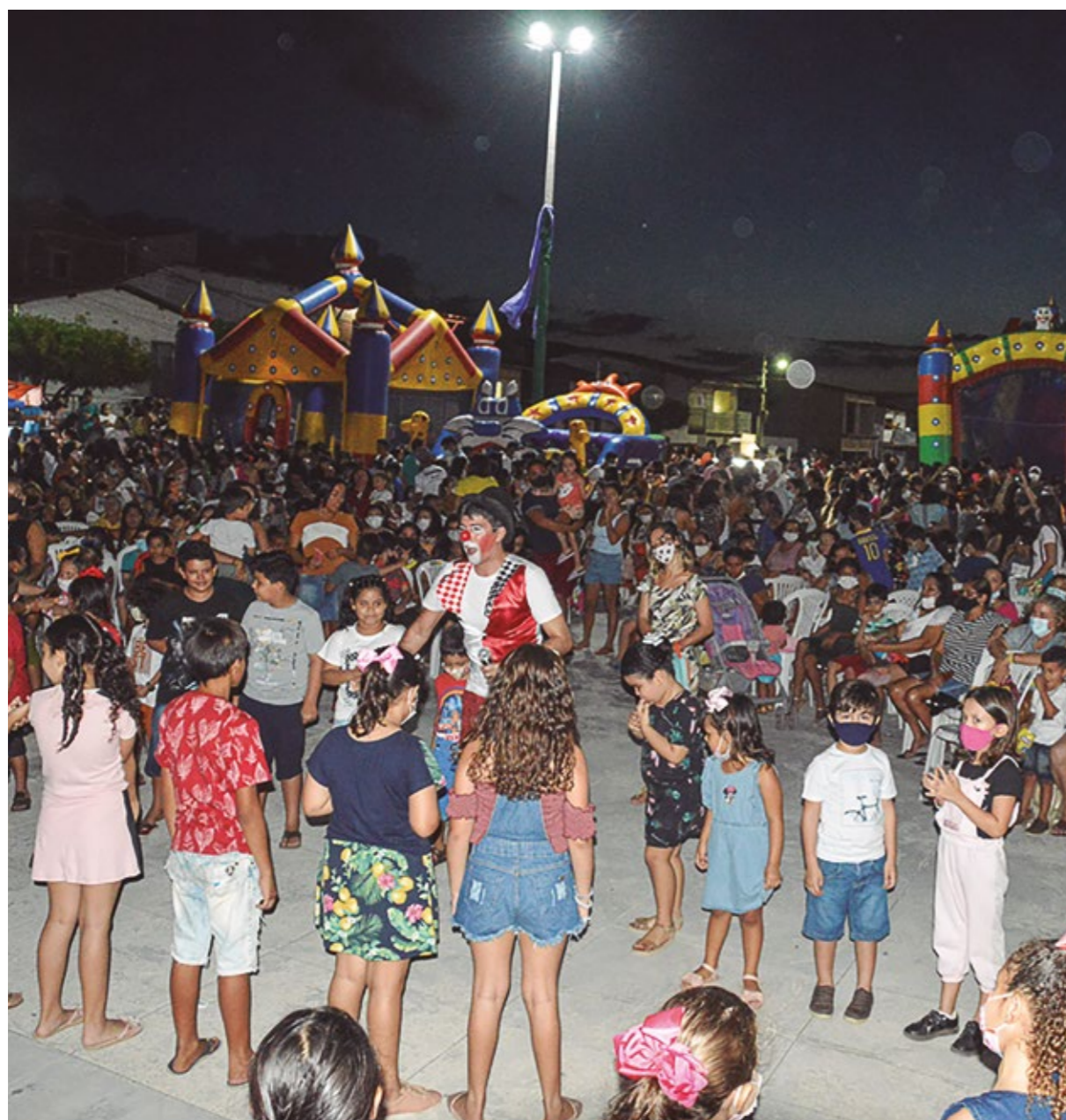
FESTA DAS CRIANÇAS DE ACARI