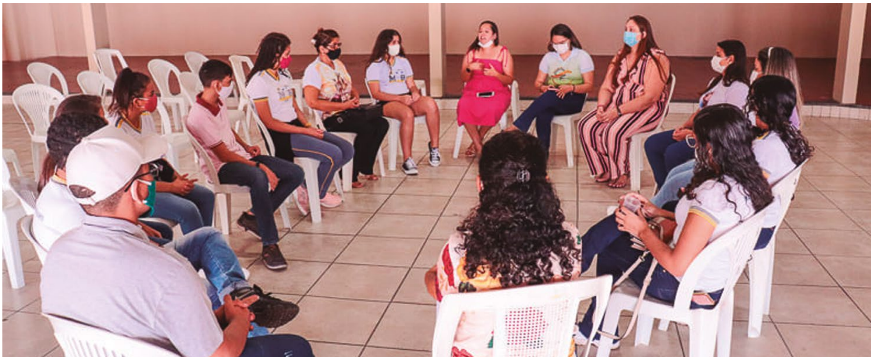
RODA DE CONVERSA COM O TEMA VIOLÊNCIA CONTRA A MULHER