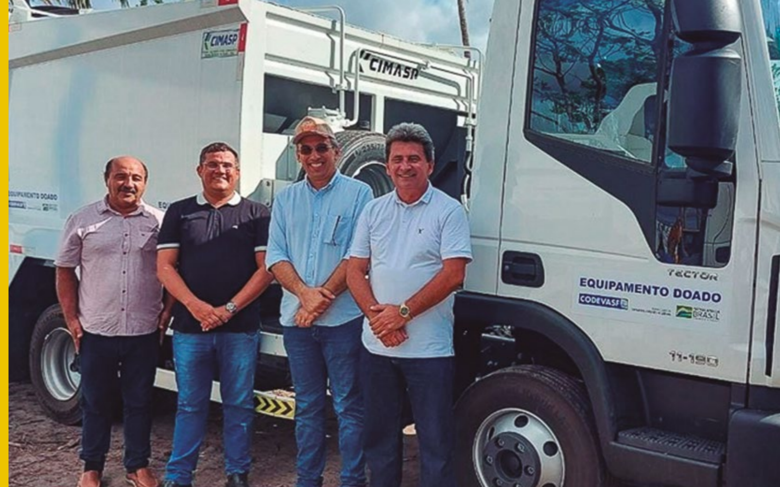
MAIS UM VEÍCULO RECEBIDO PARA A FROTA DA CIDADE