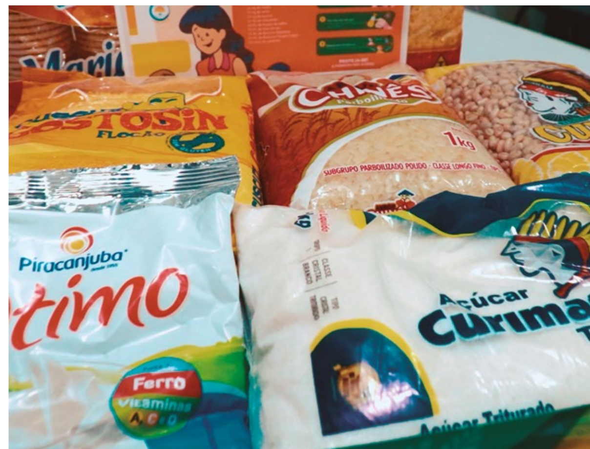
KIT MERENDA ESCOLAR, AMENIZANDO O IMPACTO GERADO PELA PANDEMIA

FORAM ENTREGUES EM MÉDIA 7.000 KG DE ALIMENTOS