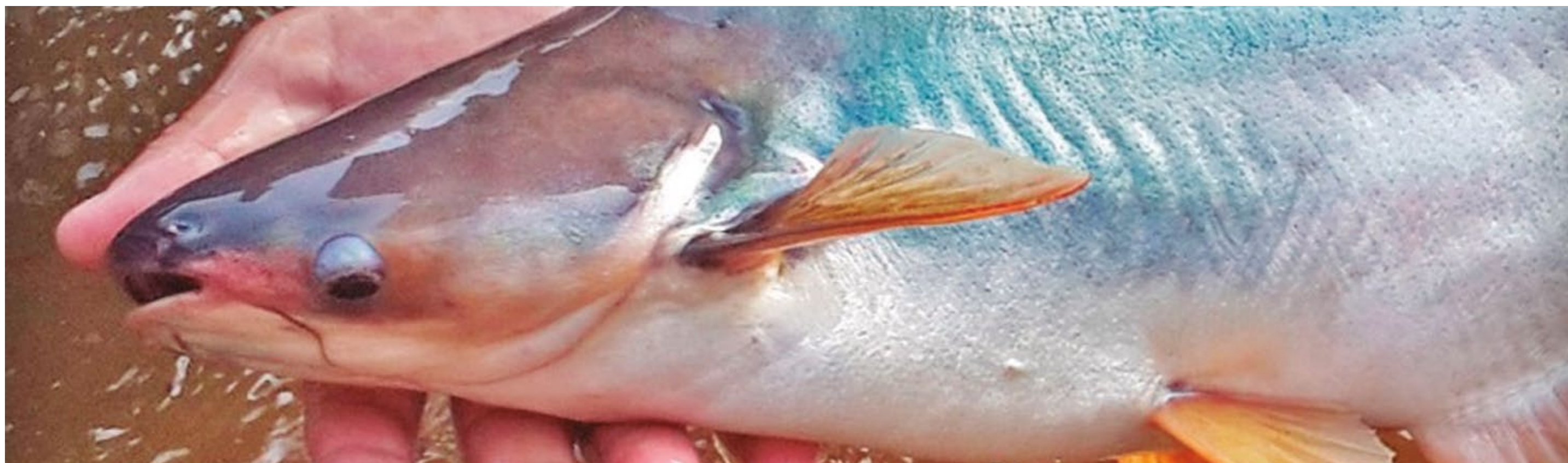
PREFEITURA INCENTIVA A IMPLANTAÇÃO DA PRODUÇÃO DO PEIXE NO MUNICÍPIO

pensável para as famílias assentadas, seja para o consumo das criações, seja para o uso diário em outras tarefas no campo.