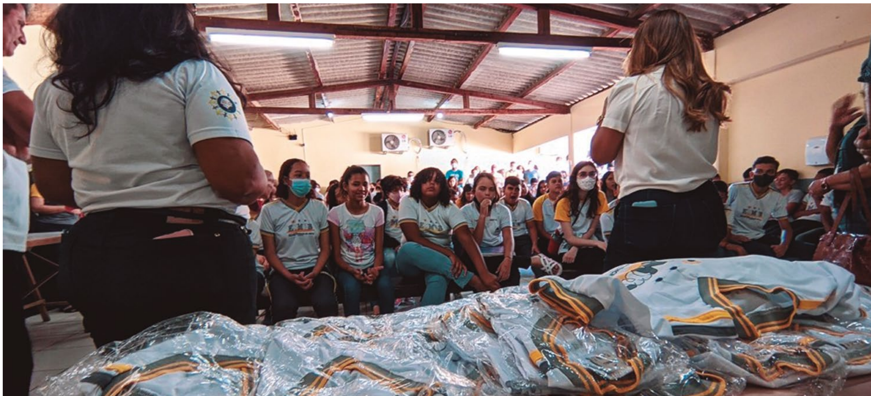
ENTREGA DE FARDAMENTOS AOS ALUNOS DA REDE MUNICIPAL DE ENSINO