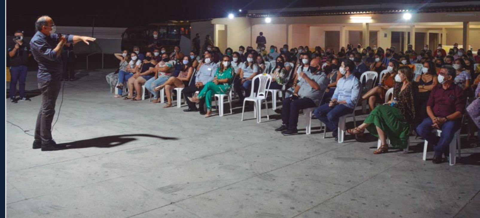
ENCONTRO DAS INDÚSTRIAS ACARIENSES DE CONFECCÕES