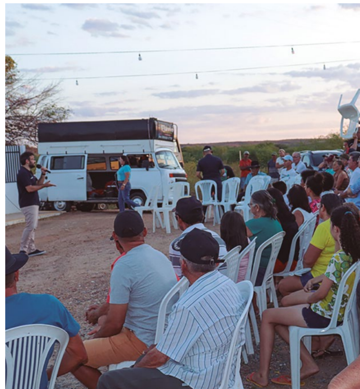
“DIA DE AÇÃO NO CAMPO”

Com o tema: “A situação dos direitos humanos de crianças e adolescentes em tempos de pandemia da Covid-19: violações e vulnerabilidades, ações necessárias para reparação e garantia de políticas de proteção integral, com respeito à diversidade”, a