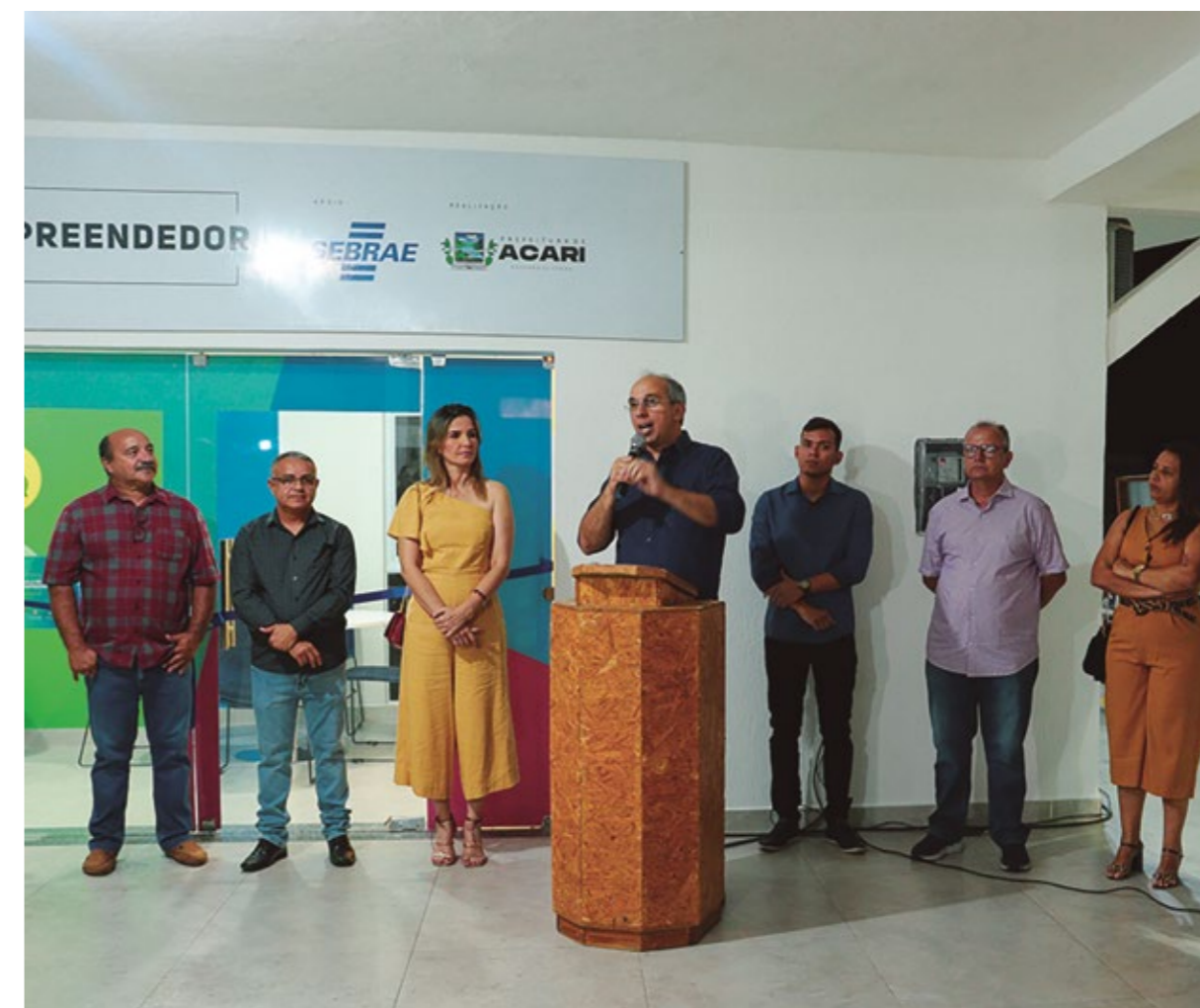
INAUGURAÇÃO DA SALA DO EMPREENDEDOR

Projeto exclusivo de cinema de rua, o Kurta na Kombi, de caráter itinerante e genuinamente potiguar, realizou em parceria com a prefeitura, via Secretaria Municipal de Educação, Cultura e Esportes, sessão de cinema em praça pública.